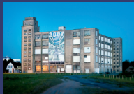
Modernisierung „NINO-Hochbau“ Nordhorn/Niedersachsen