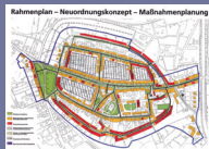
Sanierungsverfahren „Altstadt“ Mittenwalde/Brandenburg