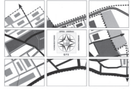
Sanierungsuntersuchung „Lindenau“ Leipzig/Sachsen