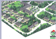
Kasernenkonversion „Churchill Barraks“ Lippstadt/Nordrhein-Westfalen